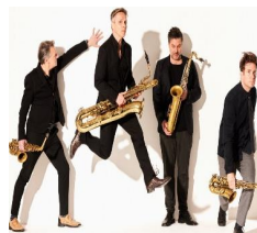
VRIIDAG 14 FEBRUARI 20:15U Artvark Saxophone Quartet