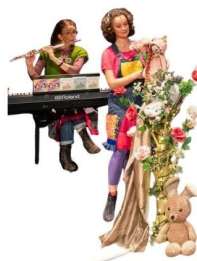
ZATERDAG 1 FEBRUARI Kinderconcerten Winter in 't Sprookjesbos