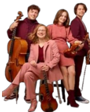
ZONDAG 20 OKTOBER 15U Animato Quartet