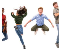
ZONDAG 1 DECEMBER 15U Laureaten PCC