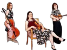
ZONDAG 13 APRIL 15U The Hague String trio